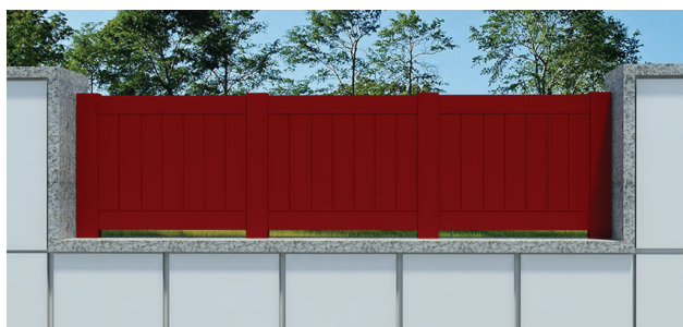
REF. a VD 01