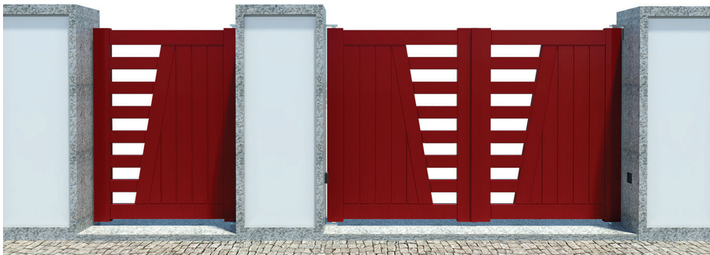
1 FOLHA - REF. a PB108