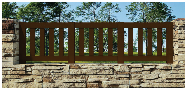
REF. a VD 02