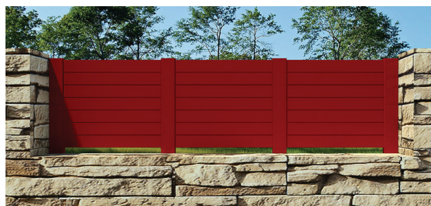
REF. a VD 01H