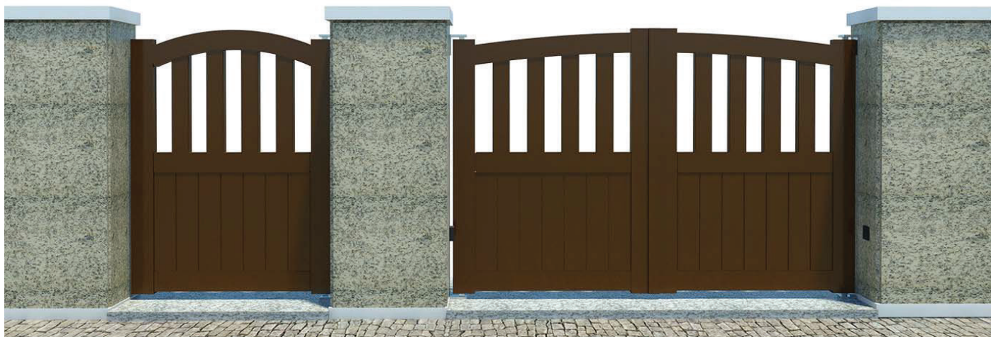
1 FOLHA - REF. a PB101