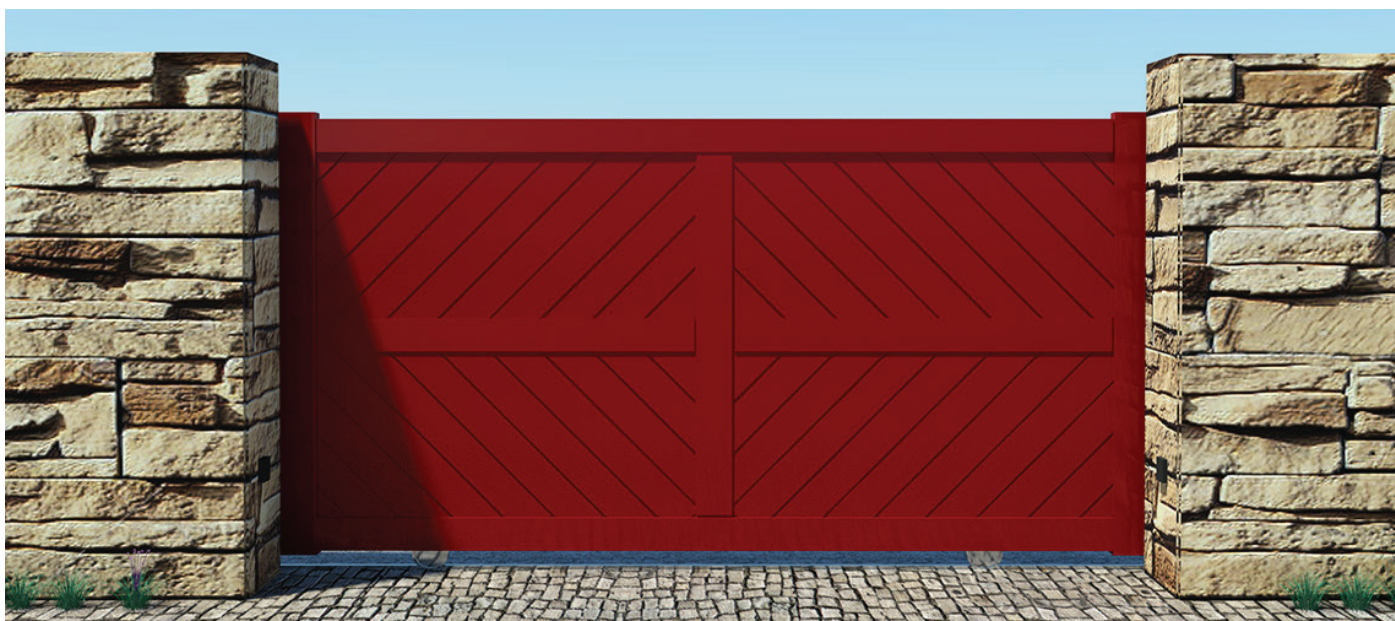
REF.ª PC LUXE 05