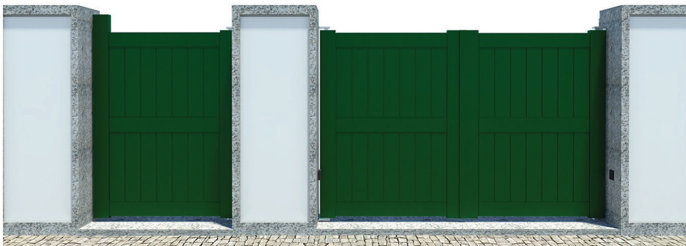
1 FOLHA - REF. a PB106