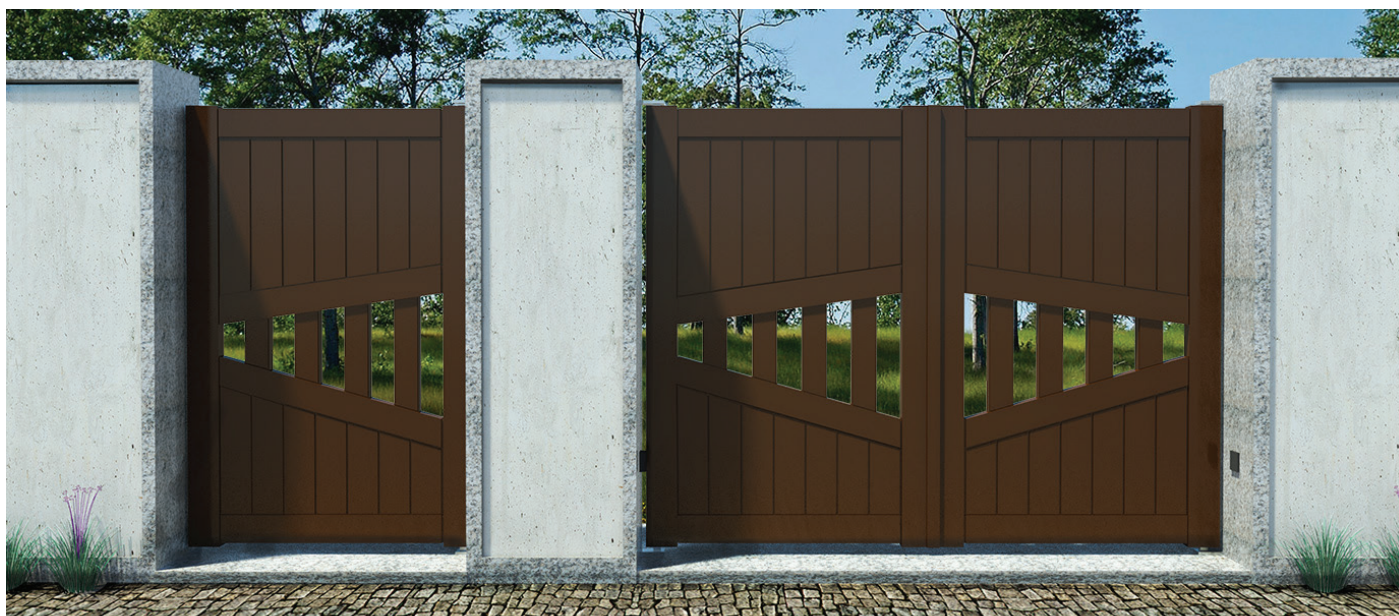
1 FOLHA - REF. a PB LUXE 104